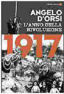
"1917-L'anno della rivoluzione" di Angelo D'Orsi (Laterza)