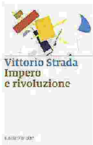
"Impero e rivoluzione" di Vittorio Strada (Marsilio)