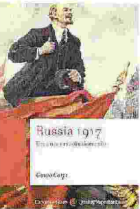
"Russia 1917-Un anno rivoluzionario" di Guido Carpi (Carocci)