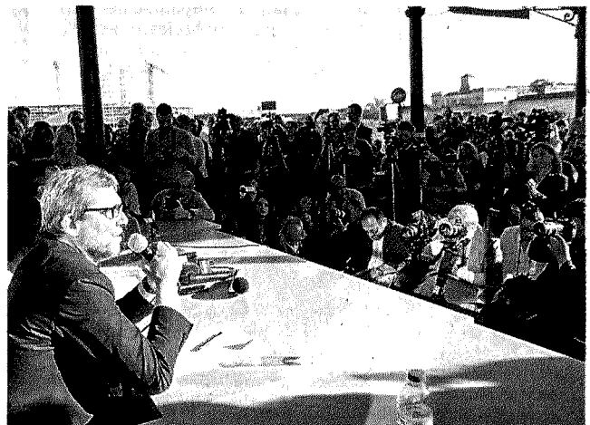
L'ultimo confronto fra candidati alla Città dell'Altra Economia

LA GHISLERI, ESPERTA DI STRATEGIE ELETTORALI: «DEBOLE SUI CONTENUTI» VELARDI: «SOTTRARSI AI CONFRONTI VIOL DIRE SFUGGIRE AI TEMI VERI»