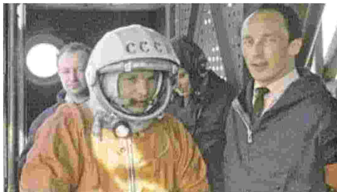
MISSIONI Jurij Gagarin. In basso Valentina Teresko e la cagnetta Laika

Eppure quello di Gagarin non era stato il primo ceffone all'Impero americano. Il 5 ottobre del 1957 un sorprendente «bip» dallo spazio aveva svegliato il mondo. Lo aveva lanciato lo Sputnik, primo satellite artificiale, da un'altitudine di 900 km. Mosca esultò. Il presidente americano Eisenhower farfugliò qualcosa di ridicolo («lo Sputnik non ha alcun valore militare») per nascondere la palese supremazia tecnologica dei