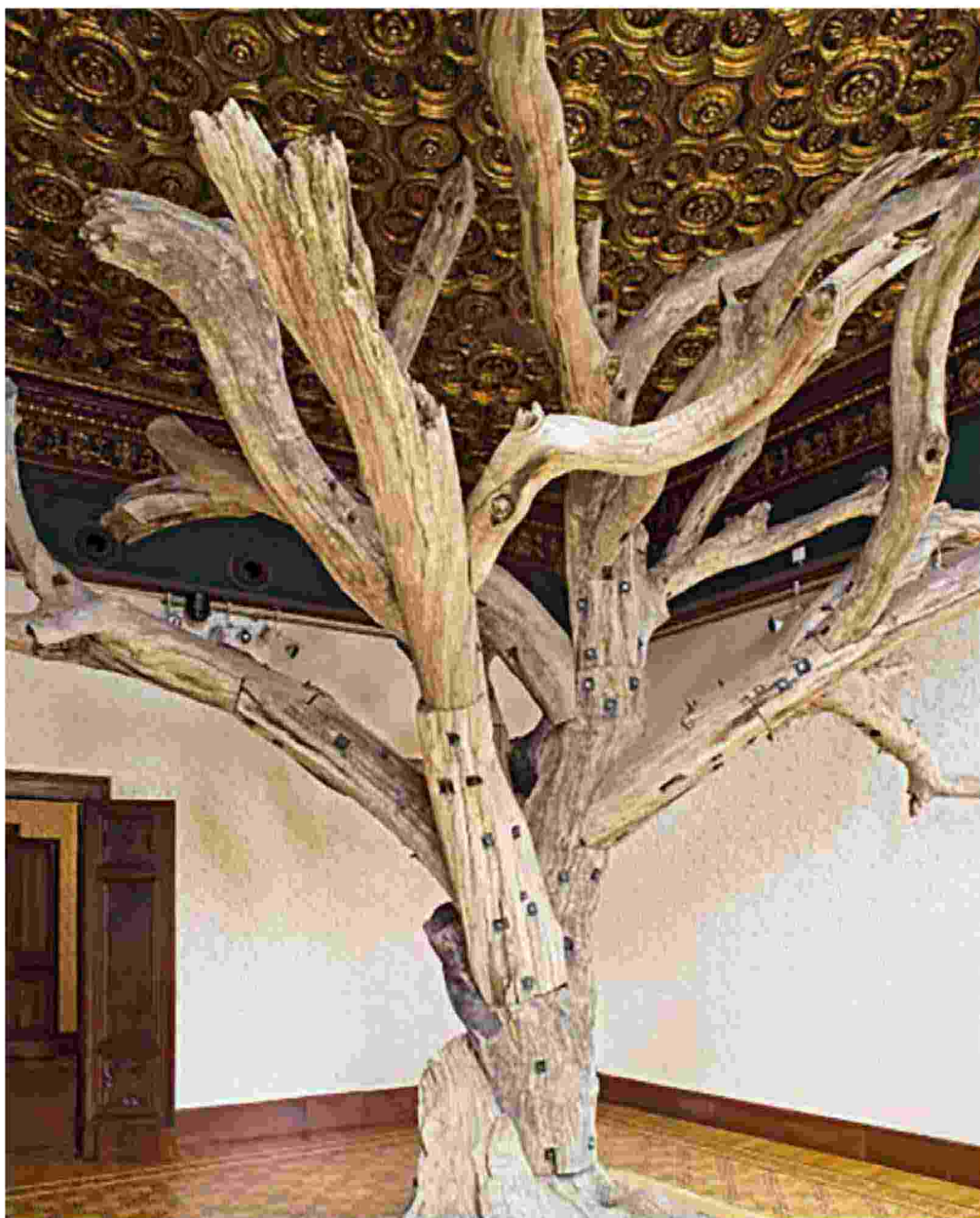
Un'installazione tratta dalla mostra «Genius Loci - Spirit of Place», curata da Greg Hilty

ta dagli incubi del fascismo, il volto dell'Europa era mutato. Le leggi economico-sociali, il pragmatismo economicista e la pura tecnicità avevano completamente soppiantato la ricerca storica, la speculazione filosofica, le arti, ma quello che rimaneva era solo l'illusione del concreto. A maggior ragione un manuale per l'Europa è necessario.