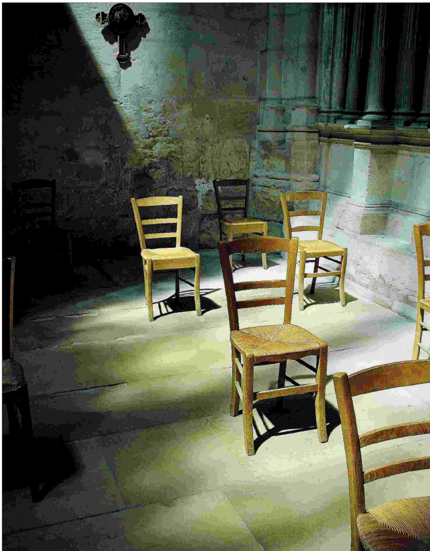
“Il programma del ‘nichilismo attivo’ si stava compiendo: tutti liberi di non cercare un senso più grande delle nostre reazioni mentali”