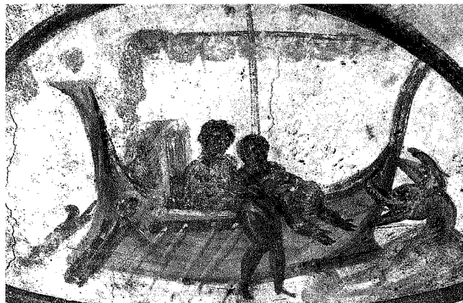
Un particolare delle Storie di Giona , (100-200 d.C.) raffigurate sull'affresco della volta delle catacombe dei Santi Pietro e Marcellino a Roma

Ritaglio stampa ad uso esclusivo del destinatario, non riproducibile.