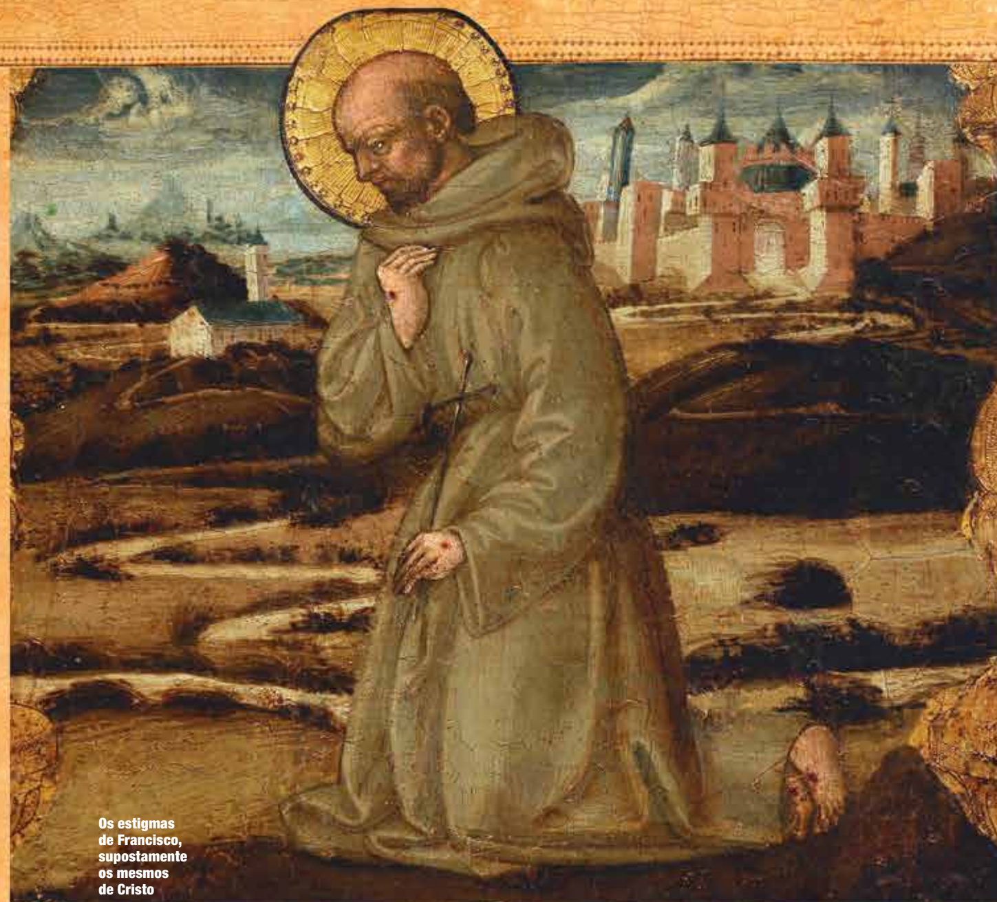
Os estigmas de Francisco, supostamente os mesmos de Cristo

Francisco desejava viver puramente os ensinamentos de Jesus