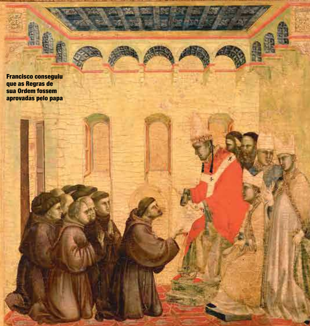
Francisco conseguiu que as Regras de sua Ordem fossem aprovadas pelo papa

Francisco foi revolucionário também em relação a si próprio e aos seus irmãos. A primeira Regra que apresentou ao papa em 1209 era duríssima. Chamada Regra Primitiva , prescrevia uma pobreza absoluta para os monges e para a Ordem, uma cópia literal da vida de Jesus Cristo e seus apóstolos conforme narrada nos Evangelhos, que não possuíam nada pessoalmente nem em comum. Era permitido aos franciscanos se vestirem somente com uma bata marrom, de tecido áspero e com uma corda na cintura. Os jejuns eram fre-