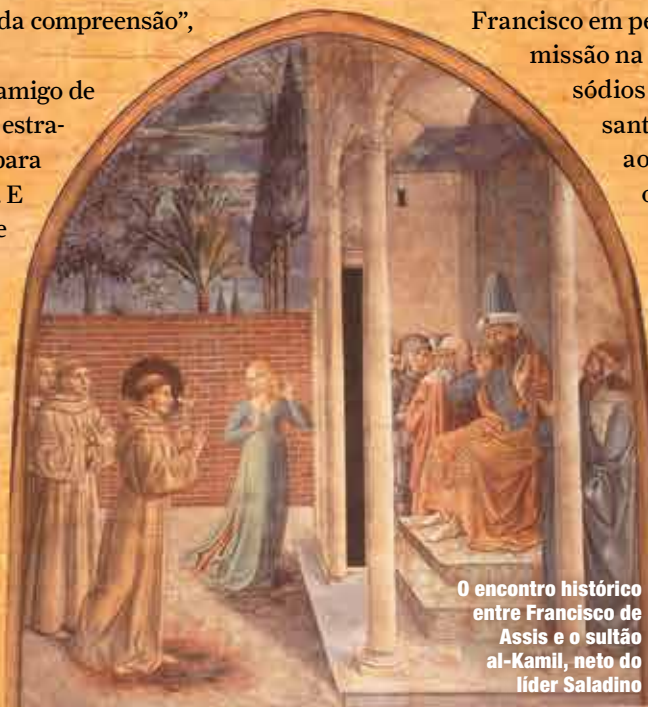
O encontro histórico entre Francisco de Assis e o sultão al-Kamil, neto do líder Saladino

Embora preferisse seguir suas regras rígidas, desde o início da sua jor-