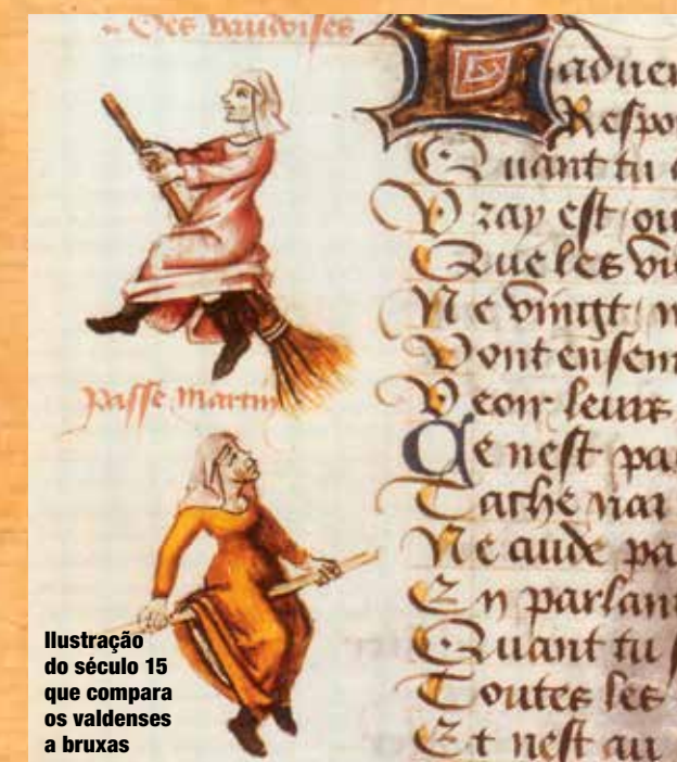
Ilustração do século 15 que compara os valdenses a bruxas

Mesmo com as notáveis semelhanças entre as ideias de Francisco e as dos heréticos da época, mesmo sendo acusado de usurpar as prerrogativas dos padres que pregavam, embora fossem leigos (Francisco e seus irmãos se tornaram diáconos muito tempo depois), o Pobrezinho de Assis escapou da fogueira. O que, então, transformou uma potencial vítima da recém-nascida Inquisição em um símbolo do catolicismo mundial? ►